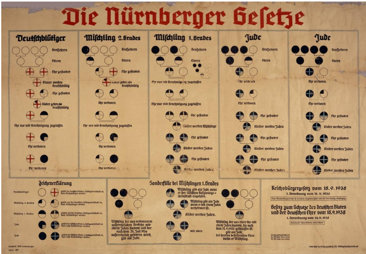
Bildtafel zum Blutschutzgesetz (1935); ( http://de.wikipedia.org/wiki/N%C3%BCrnberger_Gesetze )